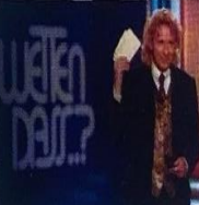
Thoma Gottschalk, Moderator der langjährigen TV-Sendung „Wetten, dass...?“