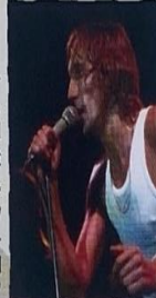
Marius Müller-Westerhagen (*1948), Rocksänger und Schauspieler mit einer Reihe von Hits wie „Sexy“, „Johnny Walker“, „Willenlos“, „Dicke“ und „Freiheit“