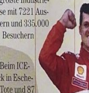
Michael Schumacher (*1969) ist der beste Autorennfahrer der 90er Jahre. Er ist der erste deutsche Formel-1-Weltmeister; er gewann 1994, 1995 und 2000