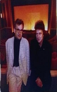
Wim Wenders (links), einer von Deutschlands innovativsten und international bekanntesten Regisseuren, drehte Filme wie „Paris, Texas“, „Der Himmel über Berlin“ und „Buena Vista Social Club“. Neben ihm ist Wolfgang Niederdecken zu sehen, der Kopf der Rockband BAP