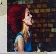
Franka Potente in Tom Tykwers Film „Lola rennt“ von 1998